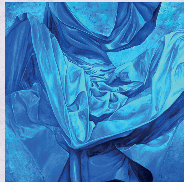
Пола сан, а пола лед, 150 x 150cm