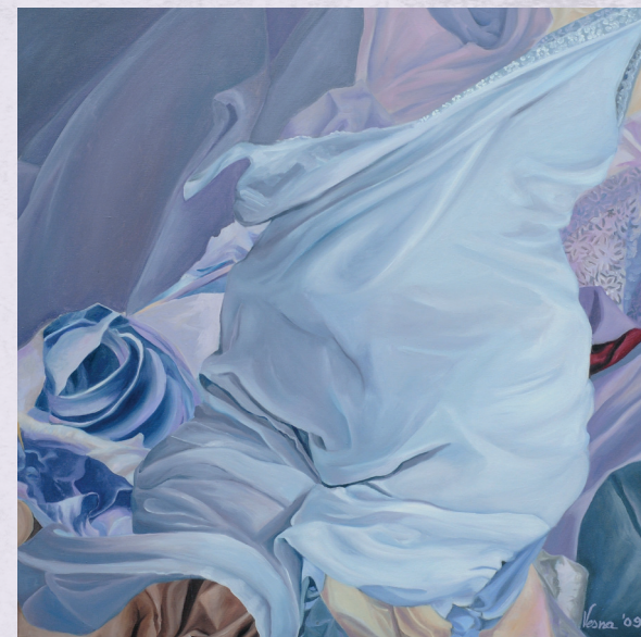
Мирише тама бела, 100 x 150cm