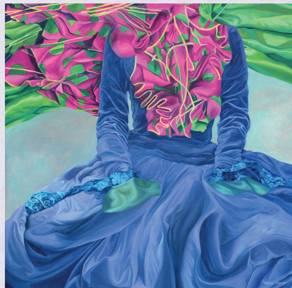
Ја сам свему на свету успаванка, 150 x 150cm